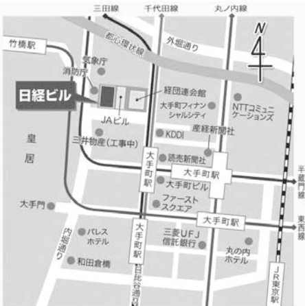
※ビル名称等は2016年12月1日付の名称です。