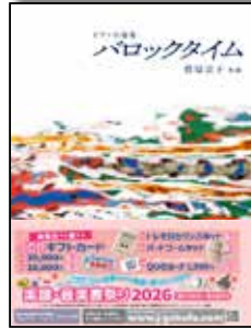
ピアノ小品集 バロックタイム

楽しくわかりやすいお話と二次元コードによるオススメ動画で、小・中学生にクラシック音楽40曲の魅力を紹介。