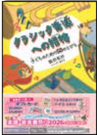
クラシック音楽への招待 子どものための50のとりばら

飯田有抄 著 A5判・128頁 定価2200円 ISBN978-4-276-21017-2