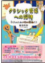
クラシック音楽への招待 子どものための40の楽曲たち

クラシック音楽ファシリテーターとして活躍中の著者が、小・中学生に向けてクラシック音楽の魅力をお話しします！楽しくわかりやすい10章、見開き50テーマ。