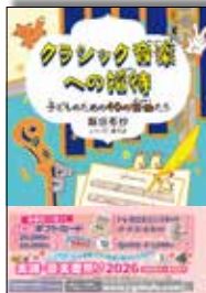
クラシック音楽への招待 子どものための40の楽曲たち

クラシック音楽ファシリテーターとして活躍中の著者が、小・中学生に向けてクラシック音楽の魅力をお話しします！楽しくわかりやすい10章、見開き50テーマ。