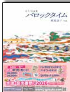
ピアノ小品集 バロックタイム

楽しくわかりやすいお話と二次元コードによるオススメ動画で、小・中学生にクラシック音楽40曲の魅力を紹介。