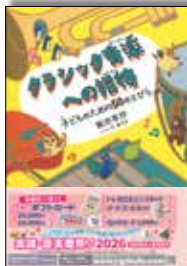
クラシック音楽への招待 子どものための50のとりびら

飯田有抄 著 A5判・128頁 定価 2200円 ISBN978-4-276-21017-2