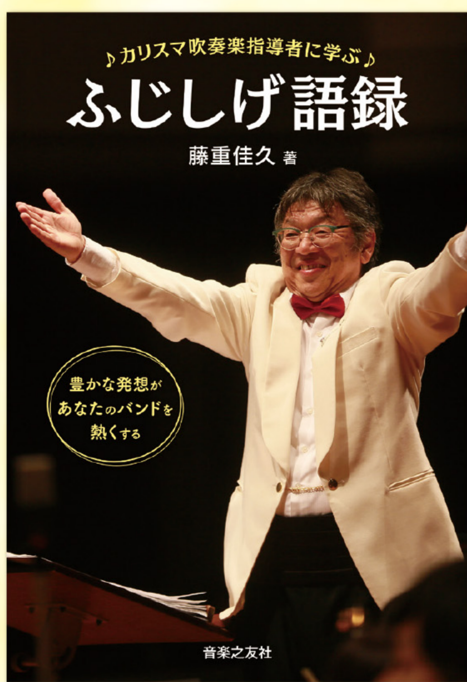
カリスマ吹奏楽指導者に学ぶ ふじしげ語録 豊かな発想があなたのバンドを熱くする

「本書は私が普段の指導のなかで、子どもたちに投げかけているちょっとした言葉や、指導者として大切にしていることをまとめたものです。私は子どもに、投げかけた言葉をよく複唱させています。なぜなら言葉には『言霊』があり、口にした言葉通りの結果が表れると思うからです。自分が発する言葉を最初に認識するのは自分自身です。それはその人の心に大きな影響を与えます」