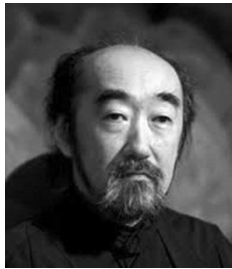
野平一郎 (のだいら・いちろう)

1953年生。東京藝術大学、同大学院修士課程作曲科を修了後、フランス政府給費留学生として、パリ国立高等音楽院で作曲とピアノ伴奏法を学ぶ。ピアニストとしてフランス国営放送フィリハーモニック、バーゼル放送響、アンサンブル・アンテルコンテンポランタン、ロンドン・シンフォニエッタなど内外のオーケストラにソリストとして出演する一方、多くの名手たちと共演し室内楽奏者としても活躍。作曲家としてはフランス文化省、IRCAMからの委嘱作品を含む80曲以上に及ぶ作品を発表。近年ではシュレスヴィヒ・ホルシュタイン音楽祭で初演されたオペラ「マドルガーダ」、パリの IRCAM で初演されたサクソフォンとコンピューターのための「息の道」などが作曲されている。最近では積極的に指揮活動にも取り組んでいる。第44・61回尾高賞、第35回サントリー音楽賞、第55回芸術選奨文部科学大臣賞ほかを受賞。2012年春、紫綬褒章を受章。現在、東京藝術大学 作曲科教授、静岡音楽館AOI芸術監督。